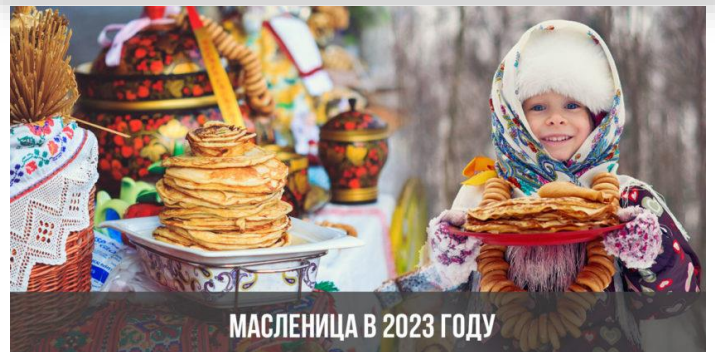
МАСЛЕНИЦА В 2023 ГОДУ